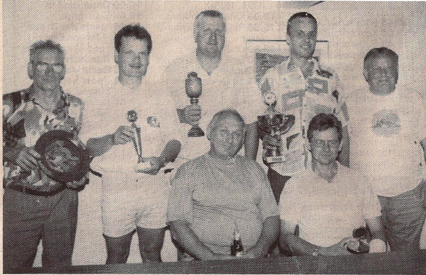
Die glücklichen Empfänger von Ehrenpreisen.