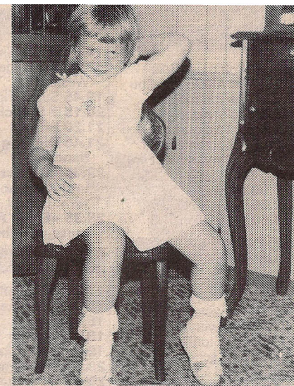
Beim Platznehmen ertönte Musik.