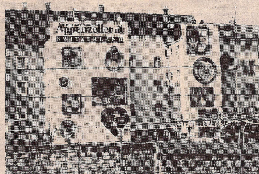
Der Basler Hauptbahnhof ist ein idealer Platz für die Appenzeller-Galerie an der Fogal-Wand.

Charakter. Die Bilder heben sich wie in einer richtigen Galerie, nur zigmal grösser, plastisch vom Untergrund ab. Die riesige Dimension der Appenzeller-Foto-Galerie erinnert gar ein wenig an Gullivers gute Stube. Basel gefällt's - die Stadt ist um eine Attraktion reicher.